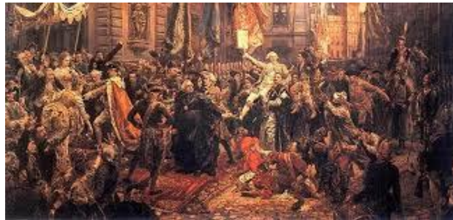
Uchwalenie Konstytucji 3 maja – obraz Jana Matejki, 1891

Uchwalona 3 maja 1791 roku na Sejmie Czteroletnim ustawa regulująca ustrój prawny Rzeczypospolitej Obojga Narodów była pierwszą w Europie i drugą na świecie nowoczesną konstytucją. Wprowadzała w Rzeczypospolitej ustrój monarchii konstytucyjnej – zachowywała stanową strukturę społeczeństwa, ale otwierała perspektywy dalszych przekształceń systemu państwowego. Na jej podstawie przyjęto monteskiuszowski podział władz na prawodawczą, wykonawczą i sądowniczą, a także zniesiono m.in. liberum veto, konfederacje i wolną elekcję. Choć Konstytucja 3 maja obowiązywała jedynie przez 14 miesięcy, była wielkim osiągnięciem narodu polskiego chcącego zachować niezależność państwową oraz zapewnić możliwość rozwoju gospodarczego i politycznego kraju.